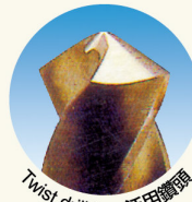
Twist drill bits 泛用鑽頭