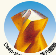
Deep-slot drill bits 深穴鑽頭